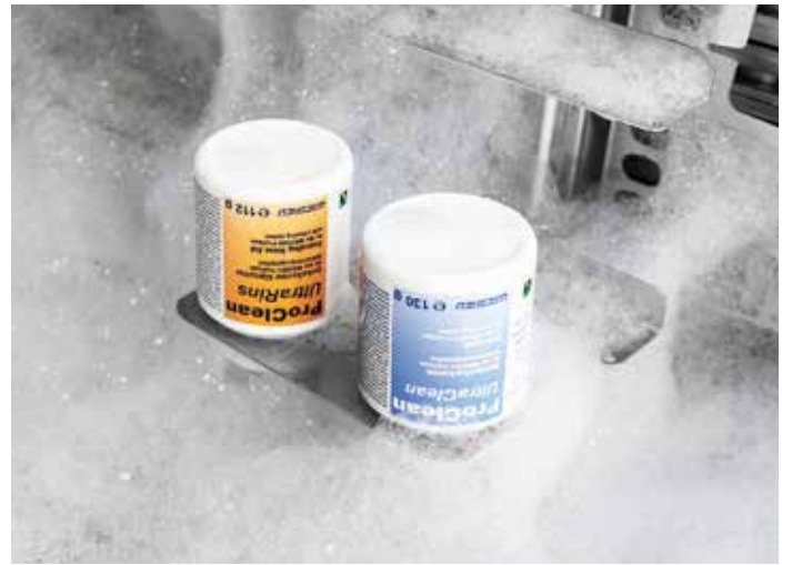
Otomatik temizlik sistemi ProClean